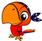
แก้วจาลัลลาเอ้