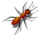
มดหยิ่งนิ่งสนิท